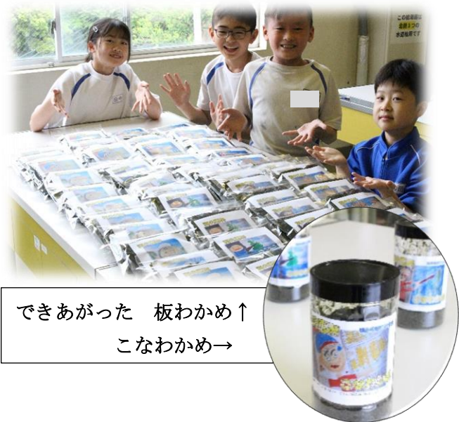
できあがった 板わかめ↑ こなわかめ→

地域の中で、子どもと越廼地区の、福井県の未来につながる授業をめざし先生方も頑張ります。