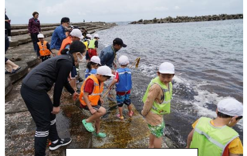
全校でわかめ採り