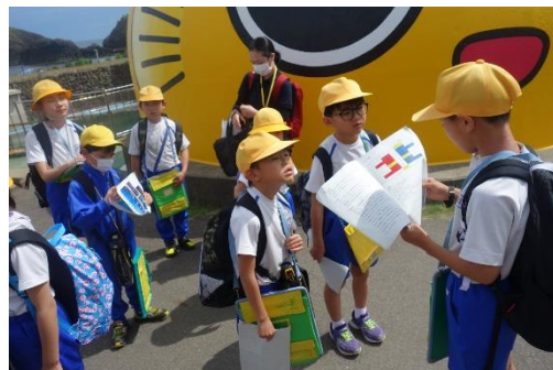
校外学習リーダー

新型コロナウイルスが5類に移行された日以来、全校で行える活動が増えてきました。その中で、がんばっているのが、活動を引っばるリーダーさん。様々な場面で、リーダーさん中心で活動できるよう下準備をして活動に臨んでいます。特に4年生は、新しく委員会のメンバーになったこともあり、一生懸命にリーダーを務めています。また、5・6年生のキビキビとした行動が、全校での活動にメリハリをつけてくれています。さすが5・6年生。それぞれの学年でのこれからの成長が楽しみです