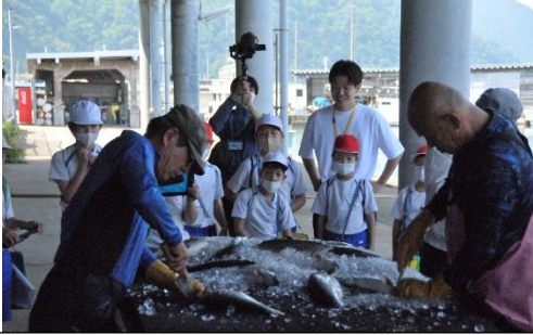
3・4年 こしのさくらます水揚げ見学