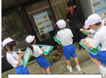
2年 まちたんけん下調べ