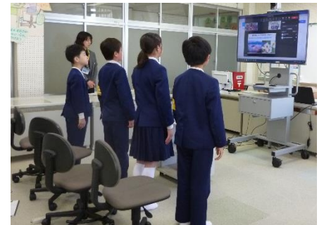
5・6年 水仙交流で福井県を紹介

今月は、越廼地区や福井県について学ぶ機会が多い月でした。これまでのわかめ採りに加え、全校で黍田商店さんに教えていただきながらのわかめ干し作業、乾燥わかめをこなわかめにする作業、越廼地区の新しい産業である「こしのさくらます」の養殖・水揚げ見学。これまで長く交流してきた岐阜県牧小学校児童の皆さんへの福井県の紹介など。どの活動も、前もって下調べをし、何のために何を目的に活動するのか、自分は何がわかり何ができるようになるのかを念頭に置き学習を進めています。