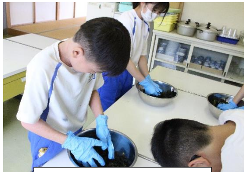
全校でこなわかめづくり