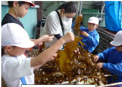
全校でわかめ干し