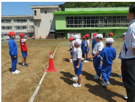
ランランタイムの進行