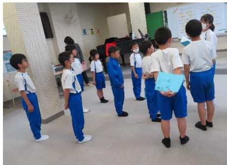
連音練習 パートリーダー